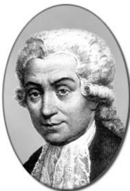
Luigi Galvani (1737-1798)