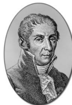
Alessandro Volta (1745-1827)